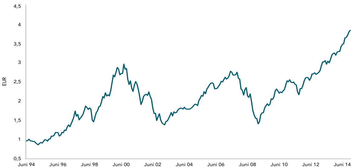
Abbildung 2 - DAS KLIMA: Vermögenswachstum, MSCI All Country IMI Index (Nettorendite in Euro)

Man kann nicht direkt in Indizes investieren. Ihre Performance enthält daher nicht die mit einem tatsächlichen Portfoliomanagement verbundenen Kosten. Die Wertentwicklung in der Vergangenheit lässt nicht auf die zukünftige schließen. MSCI Daten © MSCI 2015, alle Rechte vorbehalten.